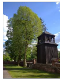
Jedna z lip na placu kościelnym