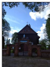
Kościół w Niesulkowie