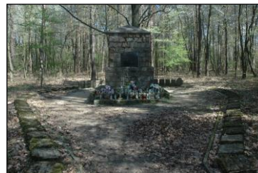
Mogiła zbiorowa na cmentarzu w Poćwiardówce