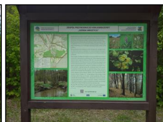
Tablica edukacyjna przy wiatkach