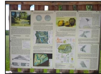
Tablica edukacyjna przy przystanku autobusowym w Starych Skoszewach

Jaka moneta przedstawiona została na tablicy stojącej przy przystanku autobusowym naprzeciwko sklepu? Czyj wizerunek widnieje na rewersie monety?