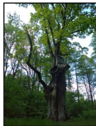
Pomnik przyrody „Dąb Jarosław”