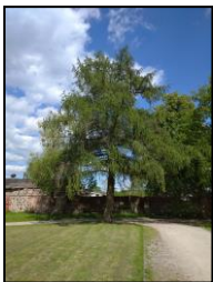
Drzewo iglaste przed dworem