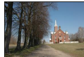
Kościół mariawicki w Dobrej

Zadanie: Podaj ile, i jakich drzew rośnie w alei prowadzącej na odcinku od kościoła do cmentarza.