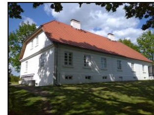
Dwór w Byszewach