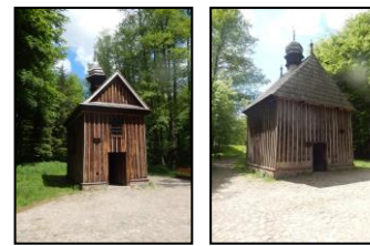
Kapliczki w Łagiewnikach

b) Wizerunki jakich świętych, znajdują się na obrazach na ścianach bocznych wewnątrz kapliczki św. Rocha? Podpowiedź: Jeden z nich jest patronem pszczelarzy.