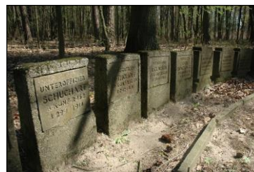
Płyty nagrobkowe stojące za mogiłą zbiorową