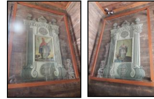
Wizerunki świętych na obrazach w kaplicy św. Rocha i św. Sebastiana