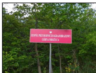
Tabliczka graniczna ZP-K „Górna Mrożyca”