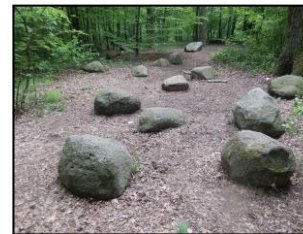
Głazowisko nad Bzurą

b) Policz i podaj liczbę głazów, jakie znajdziesz w tym miejscu.